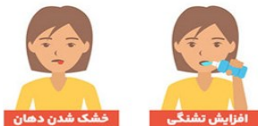
خشک شدن دهان